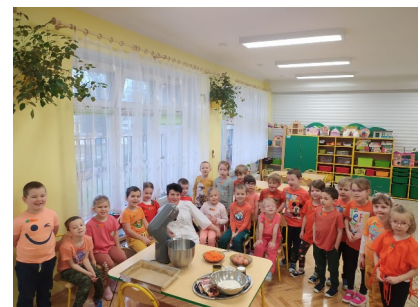
Ciasto marchewkowe robione z szefową kuchni.