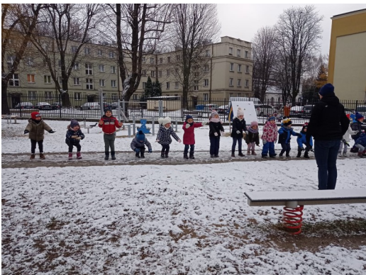
Ćwiczenia gimnastyczne na świeżym powietrzu.