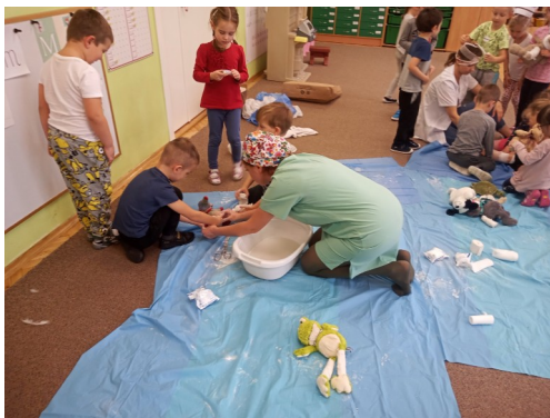
Spotkanie z Panią Pielęgniarką.