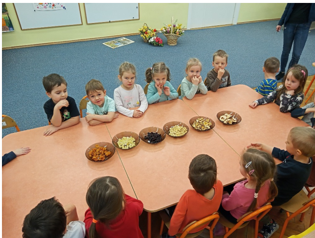
Zdrowe suszone owoce.