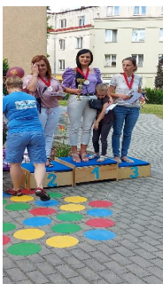
Sportowy Piknik Rodzinny