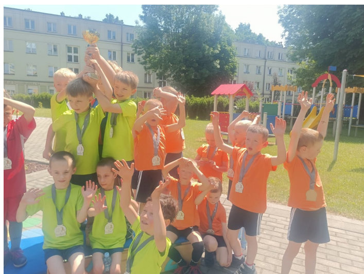
Przed szkolny turniej piłki nożnej.