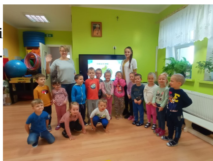
Wizyta Pani Dietetyk.