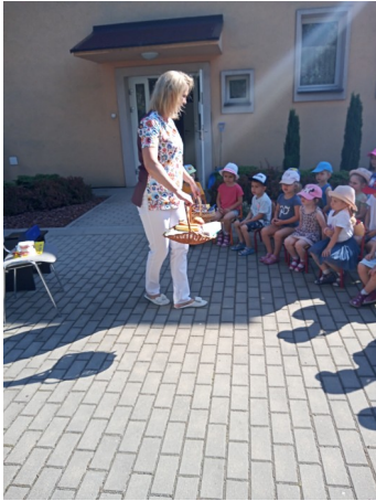
Wizyta Pani Stomatolog.