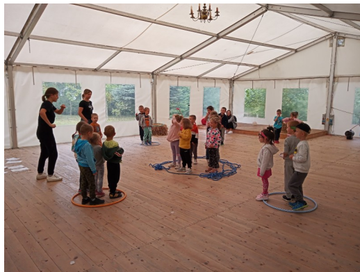
Dzień jabłka w Albigowej.