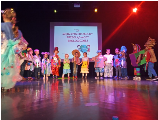
Przeгляд przedszkoli Eko-moda.