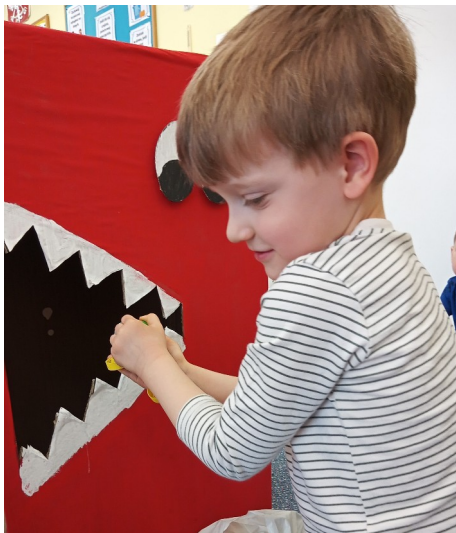
Korkojadek i recykling.