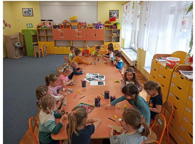
Dzień bez zabawek.