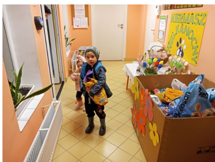
Akcja Charytatywna dla schroniska dla zwierząt w Rzeszowie