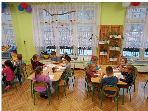
Dzieci tworzą logo Przedszkola Promującego Zdrowie.