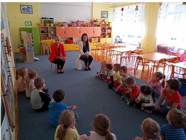
Spotkanie z Paniami z sanepidu.