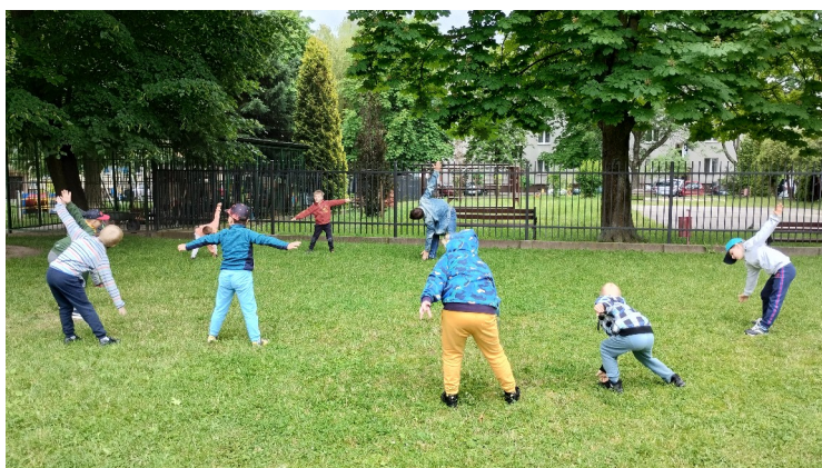
Ćwiczenia gimnastyczne na świeżym powietrzu.