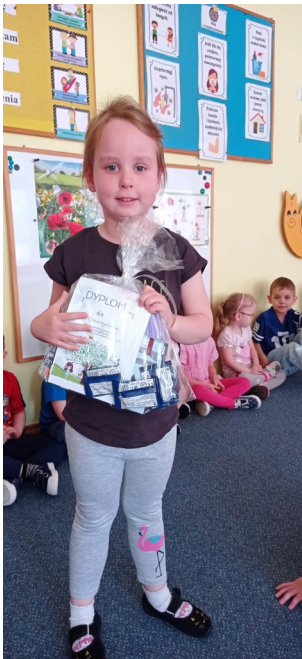
Udział w konkursie fotograficznym ekomoda.